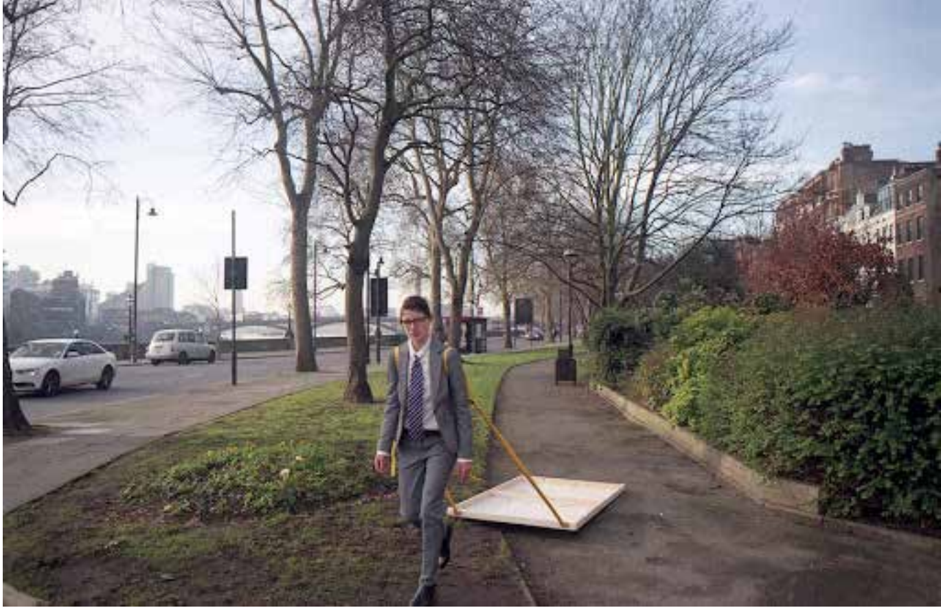
Body Surface Area, London, 2014, performance and video documentation, 5' 27' hd looped, detail