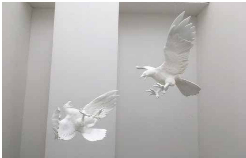
Aquile, 2018, 3D printing and white recycled plastic, 110 x 80 x 100 cm

Ich will damit sagen, machen wir es nicht schlimmer für uns selbst und/oder unseren Mitmenschen. Die Zeit Zuhause schenkt uns auch Möglichkeiten neues zu erlernen oder alles zu übertreffen.